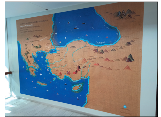
Οι 7 πατρίδες των Μικρασιατών

γάλο ενδιαφέρον και μας εντυπωσίασε όλους. Ο πλούτος της έκθεσης μεγάλος, φωτογραφίες, διάφορα κειμήλια, μουσικά όργανα και βιβλία της εποχής, ηχογραφημένα τραγούδια, συγκινητικοί στίχοι και ένα πάλλο έτοιμο να υποδεχθεί μουσικούς για παράσταση. Με συνέπεια η μια ώρα της ξενάγησης να μην είναι αρκετή για να δει κανείς όλες τις λεπτομέρειες. Ακόμα διπλάσιος και τριπλάσιος χρόνος δεν θα ήταν αρκετός.