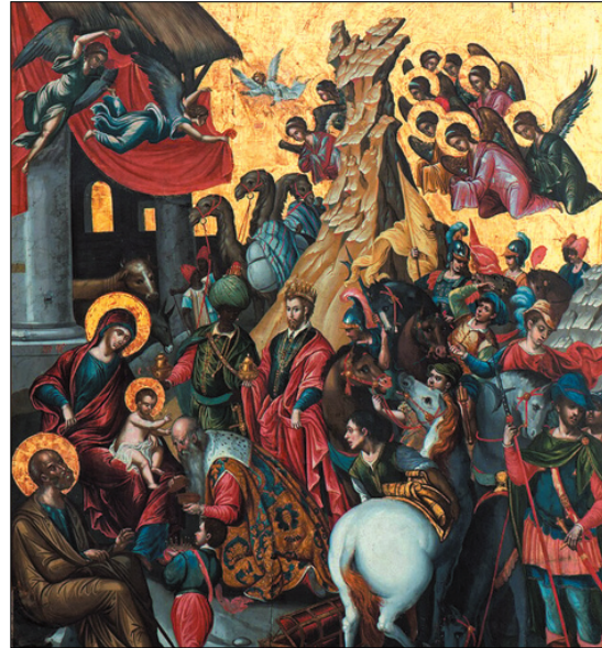
Προσκύνηση των Μάγων

Τα περισσότερα από τα 46 έργα της έκθεσης ήταν σχετικά πρόσφατης δημιουργίας,