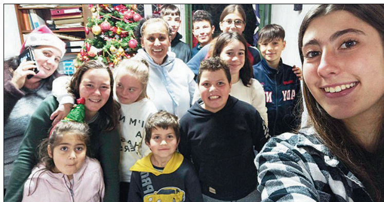
Φωτογραφικό στιγμιότυπο από την χριστουγεννιάτικη εορταστική εκδήλωση το Σάββατο 10 Δεκεμβρίου στο γραφείο της κοινότητας.

Στα πλαίσια αυτά ο Σύλλογος οργάνωσε και πραγματοποίησε, για το δεκάημερο των εορτών των Χριστουγέννων και του Νέου έτους τις παρακάτω εορταστικές εκδηλώσεις, δίνοντας έντονο εορταστικό χρώμα στο χωριό μας.