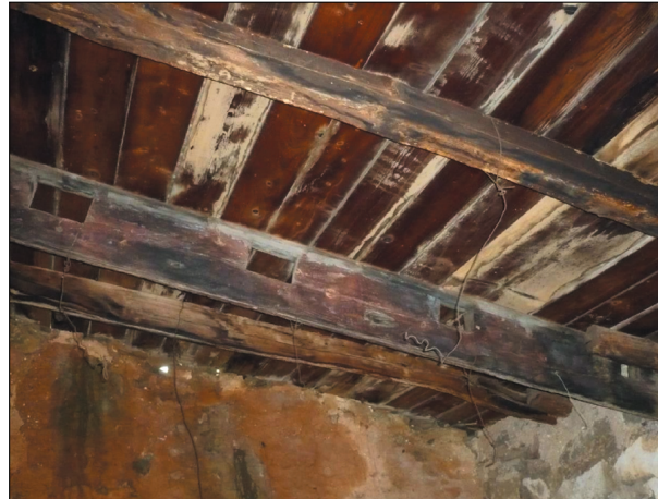
Εικόνα 1. Διακρίνονται οι εγκοπές από την κουπαστή και ξύλο, πιθανώς από το κατάρτι.

Μια τέτοια αγροικία υπάρχει στην περιοχή από την Πλάκα προς Φουρνή, σε μια τοποθεσία που λέγεται “Μπαμπούρι!”. Η αγροικία αυτή με ξυλόφουρνο στην αυλή και μαντριά, μαζί με τον περιβάλλοντα αγρό, ανήκε στον Γεώργιο Μπουραντά (1835-1930), γεωργό από τις Πίνες και στη συνέχεια παραχωρήθηκε στο γιό του Νικόλαο Μπουραντά (1880-1971) και μέχρι πριν μερικά χρόνια ήταν ιδιοκτησία του Ναπολέοντος Μπουραντά, γιού του Νικόλαου και εγγονού του Γεωργίου. Το ιδιαιτέρως χαρακτηριστικό της είναι ότι τα ξύλα, πάτερα ή δοκάρια και το ταβάνι, στα οποία στηρίζεται η κεραμοσκεπή της, προέρχονται από τα ξύλα του τουρκικού καραβιού, που αιχμαλωτίστηκε από τους Κρήτες Επαναστάτες στην Ελούντα το Μάρτιο του 1897! Η πληροφορία προέρχεται από τον αξιωματικό Εμμανουήλ Νικ. Μπουραντάκη (1917-2011) γιό του Νικ. Γ. Μπουραντά και εγγονό του Γεωργίου, ο οποίος στα παιδικά του χρόνια εργαζόταν οικογενειακά στα γύρω κτήματά τους και έμενε εκεί με τους παππούδες του. Τα αναφερόμενα εδώ ξύλα του αιχμαλωτισθέντος Τουρκικού καραβιού, δόθηκαν μαζί με άλλα είδη, τιμητικά, ως επιβράβευση κατά προτεραιότητα, κατά τη διανομή των λαφύρων στην οικογένεια του Γεωργίου Μπουραντά, μετά το διαμελισμό (διάλυση) του καραβιού, για τη θυσία του γιού του Ιωάννη Μπουραντά, που σκοτώθηκε κατά τη διάρκεια της μάχης κατάληψής του. Στη μάχη αυτή σκοτώθηκε και ο Γεώργιος Ζερβός από την Ελούντα και μάλιστα