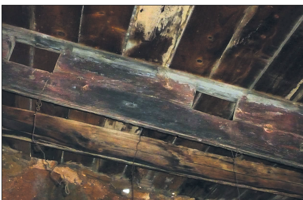
Εικόνα 2. Εδώ εγκοπές από την κουπαστή ή πολεμιστρες.

από την ίδια σφαίρα. Πρόκειται για ξύλα προφανώς από την κουπαστή ή πολύ πιθανό να είναι πολεμιστρες (τα δοκάρια φέρουν και εγκοπές της κουπαστής, αλλά μπορεί να είναι και πολεμιστρες όπου τοποθετούσαν τα τυφέκια ή κανόνια), τα κατάρτια και τις πλευρές ή της καμπίνας του κυβερνήτη (οι σανίδες), όπως διακρίνονται στις φωτογραφίες (βλ. εικόνες 1, 2 και 3) 2 . Συνεπώς η εν λόγω αγροικία χτίστηκε αμέσως μετά τα χρόνια εκείνα.