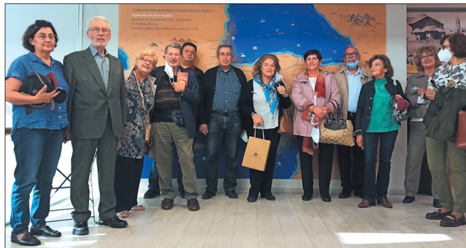
Οι Φορηγιώτες και οι Φίλοι τους

Φωτογραφικά, οπτικοακουστικά και αρχειακά τεκμήρια σημαντικών φορέων διαφύλαξης της ιστορικής μνήμης στη χώρα μας, καθώς και πλήθος τεκμηρίων που συνεισέφεραν τοπικοί σύλλογοι, οργανώσεις και ιδιώ-